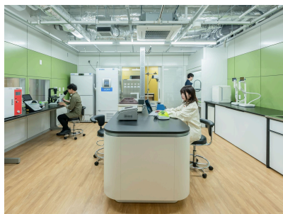
共通機器室を完備。多様な実験機器を、 必要なときに使用可能。