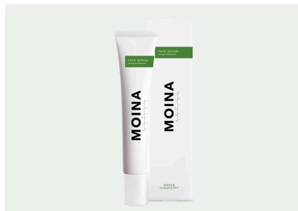
ポトリオコッセンを配合した化粧品ブランド「MOINA」。