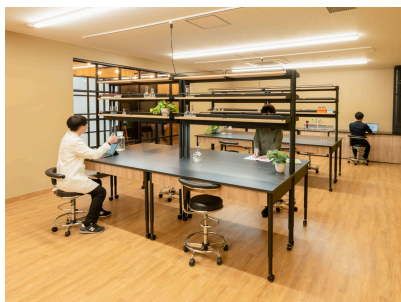
実験台・流し台を完備。 初期投資を抑えてすぐに実験が可能。

国内最大級の学術都市・つくばに構える「XiS Worksite」は、「手ぶらでScience、時々BBQ。」をコンセプトに、研究者やスタートアップが気軽に集い、実験し、つながれる場として、2024年4月にオープン。実験台・流し台などの基本設備を完備したラボスペースはすぐに使い始められ、共有・共創エリアやバーベキューテラスでは、組織や分野を超えた偶発的な出会いが生まれる仕掛けが随所に散りばめられています。