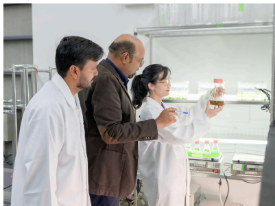
藻類の培養から素材化まで、一貫した研究開発環境を整備。