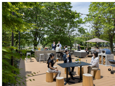
バーベキューテラスも完備。 ここから、新しいつながりが生まれる。