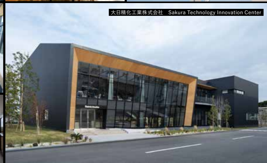
大日精化工業株式会社 Sakura Technology Innovation Center