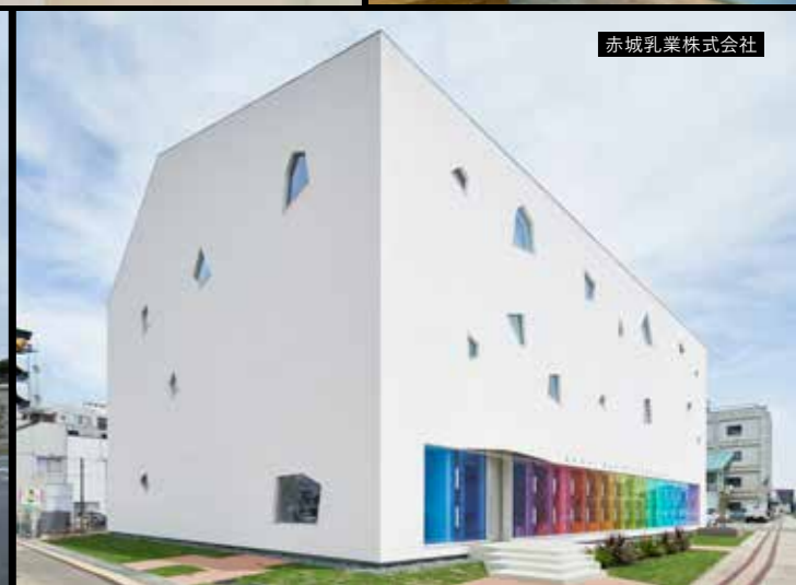
赤城乳業株式会社