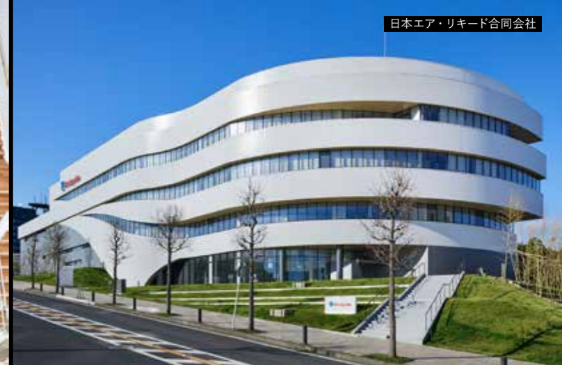
日本エア・リキード合同会社