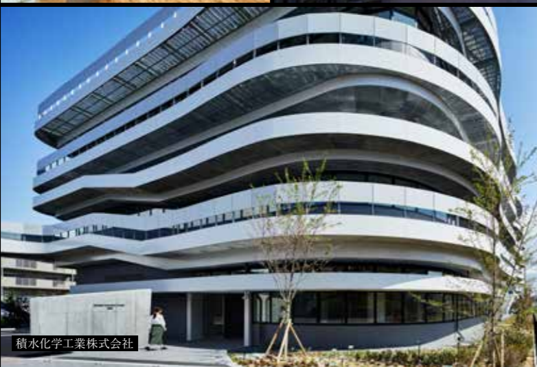
積水化学工業株式会社