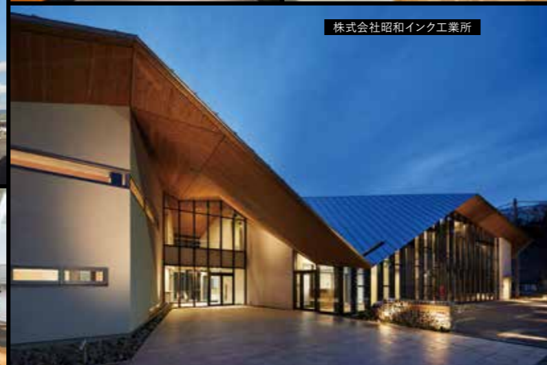
株式会社昭和インク工業所