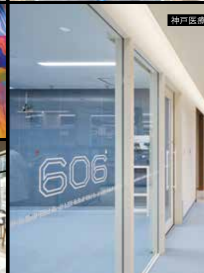
神戸医療産業都市推進機構 次世代医療開発センター HBI