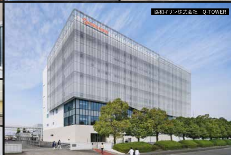
協和キリン株式会社 Q-TOWER