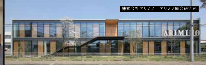
株式会社アミノ アミノ総合研究所