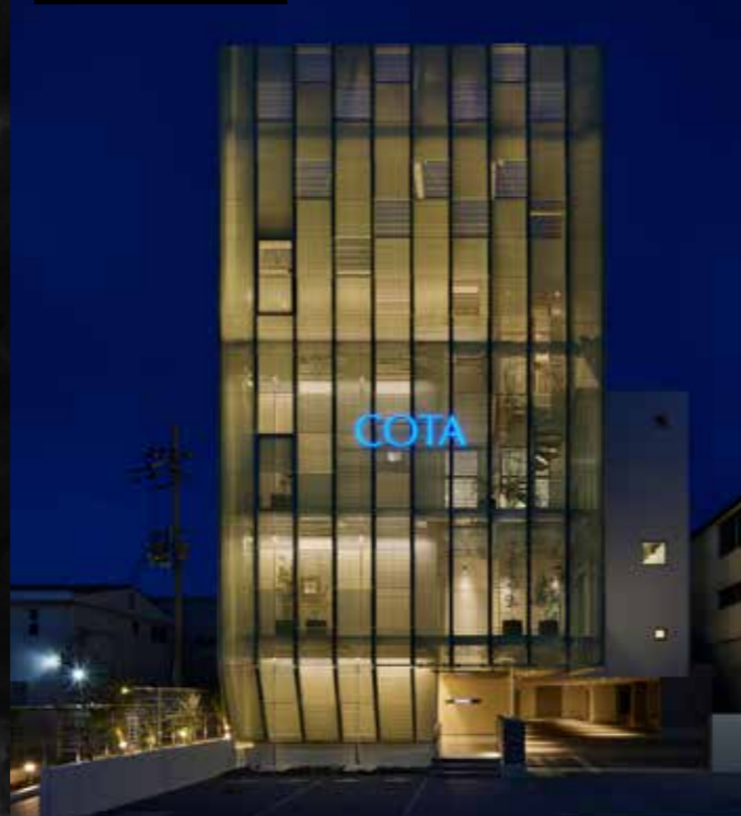
コタ株式会社 KYOTO Lab

特殊な機械設備、法規法令、将来的な変更に対応する 拡張性・柔軟性など、高度な専門性が求められる研究施設の設計。 国内唯一の研究施設に特化した一級建築士事務所として、 高い専門性と多くの実績を有するプランナ株式会社との 強固なパートナーシップにより、 「建築」と「設備機器」が調和した研究施設構築を シームレスにマネジメントします。