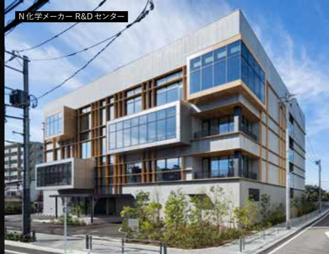
N化学メーカー R&Dセンター